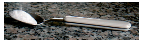
Meine tägliche Portion Vitamin C

Seit einigen Jahren nehme ich täglich Vitamin C. Schon nach einigen Tagen spürte ich eine deutlichere Besserung des Asthmas. Erkältungen kenne ich seit etwa 10 Jahren nicht mehr, trotz Umgang mit erkälteten Menschen, Velofahren mit nassen Haaren usw. Ich fühle mich auch meistens wirklich fit. Sicher ist nicht alles nur dem Vitamin C zuzuschreiben aber es trägt bestimmt seinen Anteil dazu bei. Mit Kalziumascorbat hatte ich keine guten Erfahrungen, da ich auf eine Substanz darin allergisch sein muss. Die Haut wird in kurzer Zeit deutlich schlechter.